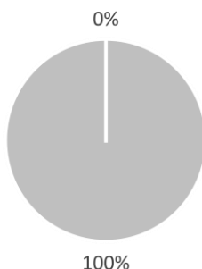
2. Alignement des investissements, y compris des obligations souveraines*, sur la taxinomie

■ Alignés sur la Taxinomie ■ Autres investissements